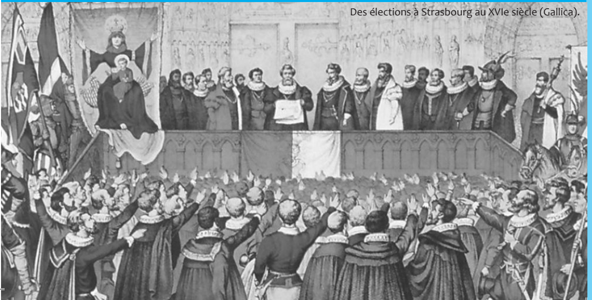
Des élections à Strasbourg au XVI e siècle.

Le fonctionnement décentralisé de nature démocratique dans les villages qui s'autogérait est un impensé de la mémoire collective, selon l'historien G. NOIRIEL. Bien avant lui, Pierre Kropotkine en faisait déjà un récit détaillé dans « L'entraide. Un facteur de l'évolution. » Au moyen-âge, les institutions des princes étaient lointaines. Ce sont des assemblées populaires plus ou moins formalisées qui permettaient d'organiser les choix des villageois-es pour ce qui concernait le commun. Ça ne fonctionnait certainement pas partout, pas tout le temps. Mais notre saturation d'images péjoratives de cette époque nous empêche d'imaginer ces aptitudes de délibération horizontale des vilains, la base majoritaire des paysan-ne-s. Une sorte de démocratie populaire de la nécessité. Les cités n'étaient pas non plus en reste. Tout comme les guildes d'artisans. Ces entités organisées ont su gagner leur autonomie politique et juridique en mobilisant l'entraide et la coopération, plutôt que le rapport hiérarchique. Serait-ce de peu d'intérêt lorsque l'on cherche à associer les origines de la démocratie avec la liberté aristocratique ou bourgeoise ?